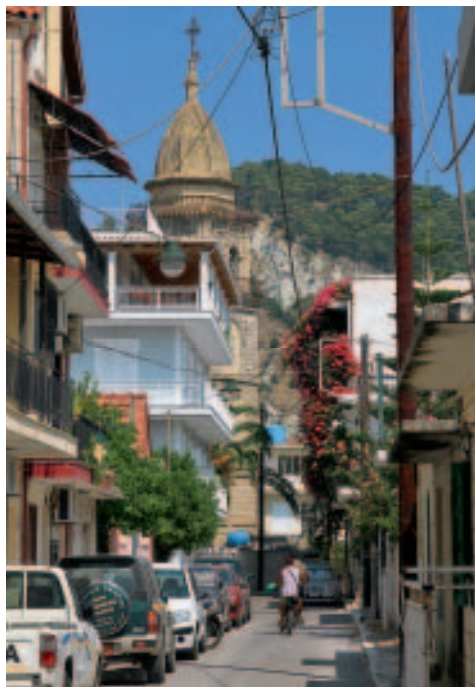
Im Gassengewirr von Zákynthos-Stadt

Museumsrundgang Er beginnt in Raum A rechts der Eingangshalle. Beherrscht wird dieser von zwei großen holz-