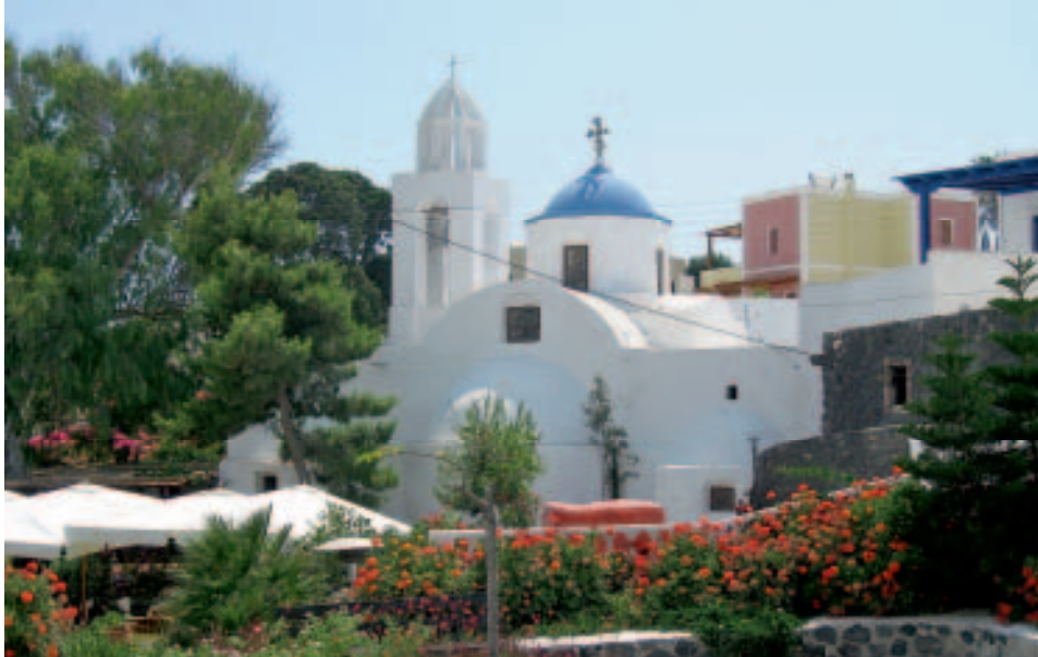
Friedlich eingebettet zwischen Häusern und Grün: Kirche in Megalochóri