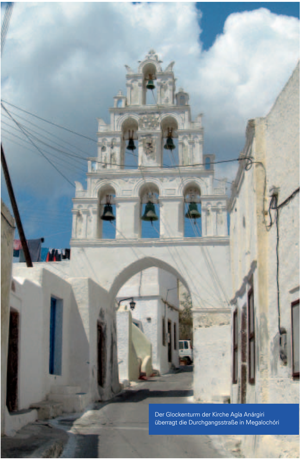
Der Glockenturm der Kirche Agía Anárgiri überragt die Durchgangsstraße in Megalochóri