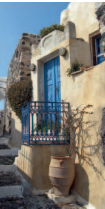
Hoch über Pýrgos: Gasse im Kastélli

Adressen Erste-Hilfe-Station an der Hauptstraße, ☎ 22860-32479. Geldautomat am Kreisverkehr. Der Bäcker ( Fóurnos ) an