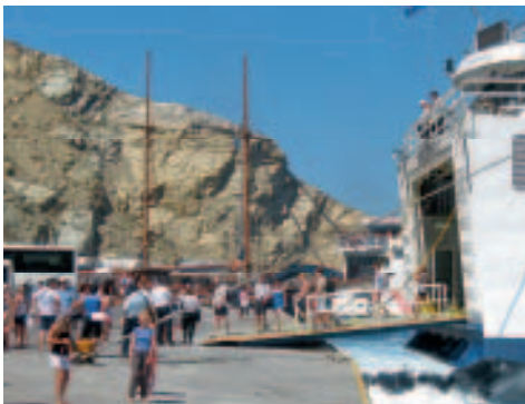
Im Hafen Athiniós

Athiniós, der ehemalige Hafen von Pýrgos, ist heute Hauptverkehrshafen von Santoríni. Nach dem Bau der auf den ersten Blick ziemlich abenteuerlich wirkenden Serpentinstraße über fast 300 Höhenmeter hat er den alten Hafen Skála in seiner Funktion abgelöst. Mit Ausnahme des Kreuzfahrttourismus wird heute praktisch der gesamte Seeverkehr der Insel über den Hafen Athiniós abgewickelt. Im Hochsommer sind der Trubel und das Chaos zwischen ankommenden und abfahrenden Schiffen beträchtlich. Die Hafenzentrale versucht den Motorfahrzeugverkehr und die Menschenströme ein wenig zu ordnen, doch oft vergebens. Athiniós ist die Bezeichnung für die Hafenanlage und kein Dorf im eigentlichen Sinne. Doch haben sich zahlreiche Restaurants und Cafés angesiedelt, die im Hochsommer teils rund um die Uhr geöffnet sind. So ist die Pier im Sommer zu