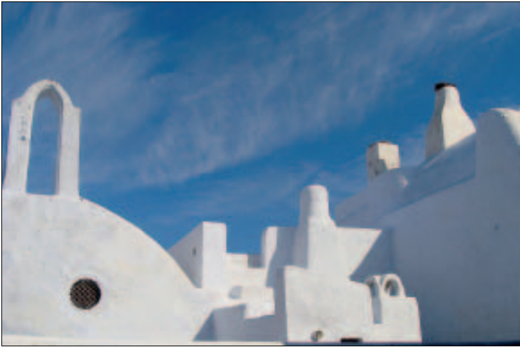
Kykladische Architektur in Pýrgos

der Hauptstraße kurz vor dem Kreisel hat leckeren Kuchen im Angebot.