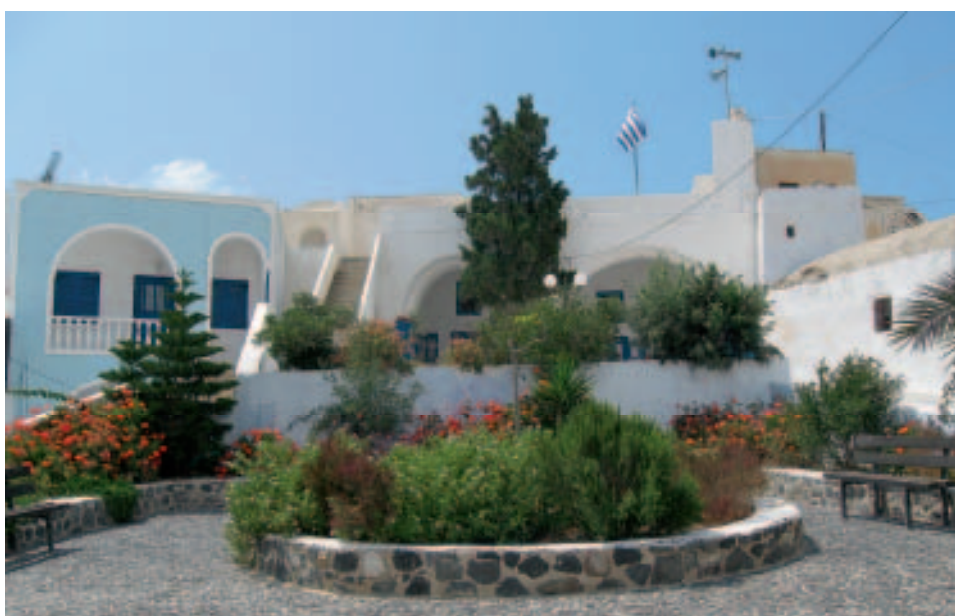
An der Platía in Megalochóri

gasse durch den Ort ist eine Einbahnstraße, die nur von Nord nach Süd befahren werden darf.