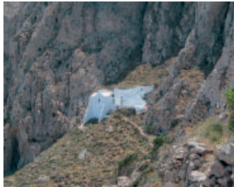
Kirche Ágios Geórgios Katefio

Kirche Ágios Geórgios Katefio: Die Kirche wurde auf etwa 320 Höhenmeter in die steile Felswand am Nordfuß des Profitis Ilías südlich von Pýrgos hineingebaut. Sie ist im Rahmen einer Wanderung (Beschreibung auf S. 256) zu erreichen. Leider ist die Kirche meist verschlossen. Im Innern befindet sich eine weiß bemalte, steinerne Ikonostase. Die Außenanlage ist ein schöner Rastplatz mit einer großen Terrasse vor dem Kircheneingang und einer weiteren Terrasse oberhalb der Kirche. Dort befinden sich Sitzgelegenheiten, aber kein Schatten. Leider wird an Werktagen die Ruhe des romantischen Orts durch den unablässigen Geräuschpegel des Steinbruchs unterhalb der Felswand gestört.