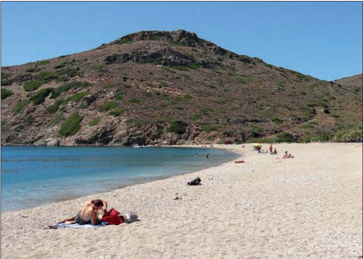
An der Paralia Felloú

nem Buchtblick. Die Gastgeber sprechen nur Griechisch. DZ ca. 30–60 €. ☎ 22820-72149, www.valsamiastudios.gr .