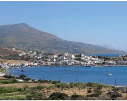
Blick auf Gávrion

Anastasia Traditional Houses , fantastische Lage hoch über Gávrion, ein Zimmer und zwei Villen mit Terrassen für 4 bzw. 6 Pers. in einem architektonisch reizvollen Natursteinkomplex im traditionellen Stil, herrlicher Blick und schöner Garten, freundlich geführt von Nikos und der Schmuckmache- rin Anastasia. Villa ca. 60–130 €. ☎ 22820-72287, 6937-972014, http://villasinandros.com .