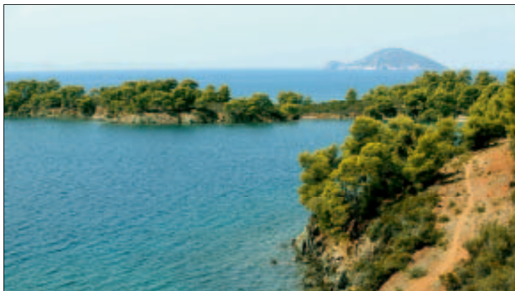
Versteckte Buchten und beste Schnorchelmöglichkeiten bei Pórtο Karrás

die antike Stadt Galipsos und die Grundmauern der Ágios-Sofrónios-Basilika bei Ágios Georgios aus dem 6. Jh. mit sehenswertem Bodenmosaik ausgegraben wurden, bleibt den meisten Urlaubern verborgen. Die steuern meist direkt auf den einladenden Strand zu. Für Freizeitgestaltung ist gesorgt (z. B. Basketballwurfanlagen), viele Geschäfte, Tavernen und Privatquartiere säumen die Straße, die zum Meer hinunterführt. Der fast 7 km lange Sandstrand ist teilweise recht schmal und schattenlos, im klaren Wasser ein wenig steinig. Gut besucht sind die feuchtfrohlichen Festivitäten, die an den Namenstagen der zahlreichen Kapellen des Ortes gefeiert werden, wie die von Ágios Pávlos , Ágios Athanásios oder Ágios Panteleímonas .