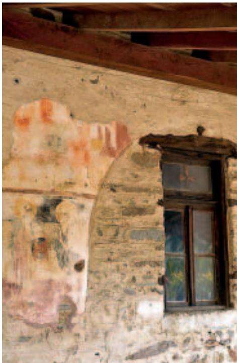
Kapelle mit Freskenresten

Geschichtliches: Auch wenn Nikíti heute vergleichsweise groß ist, spielte die Ortschaft doch lange Zeit nur eine untergeordnete Rolle auf der Halbinsel. Im Altertum waren die Orte Galipsos (nahe der Bucht von Kastrí), Fiscela und