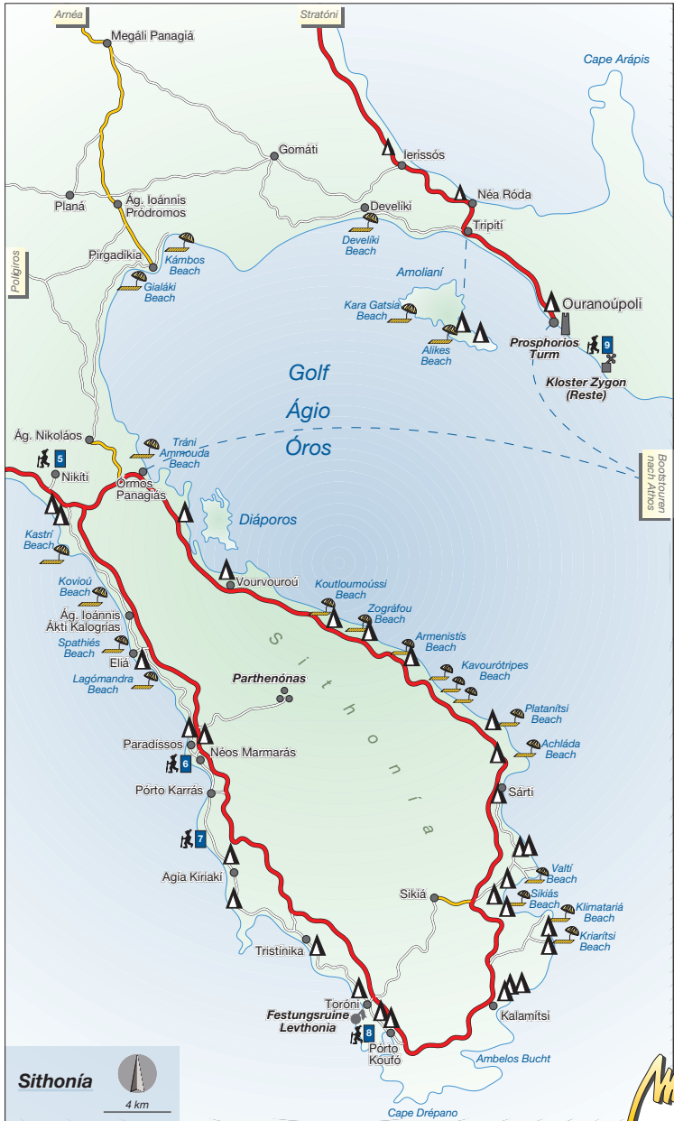
Sithonia – Ágio Óros → Karte S. 173