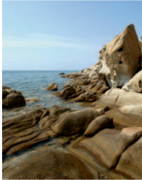
Felsauswaschungen bei Koviou-Beach

»» Mein Tipp: Elia Beach Apartment House , ein zweistöckiges Haus in traditioneller Steinbauweise inmitten eines liebevoll gepflegten Gartens. Über die wenig befahrene Uferstraße 100 m bis zum Meer. Die sehr freundliche Besitzerin Maria Psarás vermietet 14 Zimmer (zehn Apartments, zwei Bungalows, zwei Studios) mit voll ausgestatteter Küche, Bad/WC, TV, Aircondition und großen Balkonen. Frühstück im Garten, hier auch Liegestühle und Spielmöglichkeit für Kinder. Geöffnet 10.5.–10.10. In der Hochsaison DZ ab 60 €, Viererzimmer