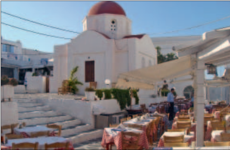
Nikos Taverne hinter der Paralia

gewürzte Schweinswurst namens loukániko . Auch das mykoniotische Mandelgebäck amygdálota und die Mandelmilch soúmada haben in Griechenland einen guten Namen (→ Mýkonos-Stadt/Shopping). Mitte der Neunziger hat sogar das einzige Weingut der Insel, die „Mykonos Winery“ (Oinopiia Mykonou, www.mykonos-wines.gr ), begonnen, drei Ökoweine (mit zertifiziertem Biosiegel), nämlich rot, weiß und rosé, sowie einen Dessertwein unter dem Label „Paraportiano“ zu produzieren, die auch in manchen Restaurants erhältlich sind.