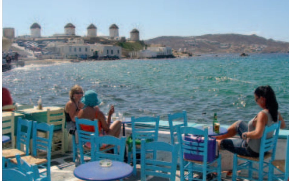
Café am Meer: Relaxen in Klein-Venedig